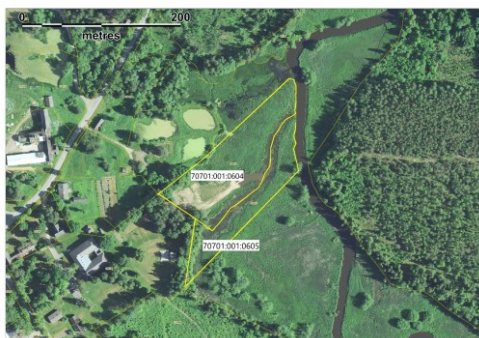
Joonis 1. Kavandatava tegevuse asukoht Ruusa külas

Kavandatava tegevuse eesmärgiks on rajada Põlva maakonda Räpina valda Ruusa külla Võhandu jõe äärde puhkeala. Kavandatud tegevused jäävad Ruusa küla üldkasutatava maa sihtotstarbega Puhkeniidu kinnistutele (70701:001:0604, 70701:001:0605). Esimese etapina kavandatakse Võhandu jõe endine harujõgi puhastada settest ca 3 900 m 3 ulatuses ning väljakaevatav sete planeeritakse kaldale madala liigniiske ala täiteks.